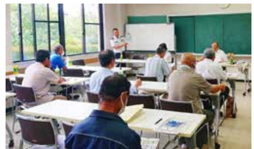
真剣に説明を聞く相談員の様子